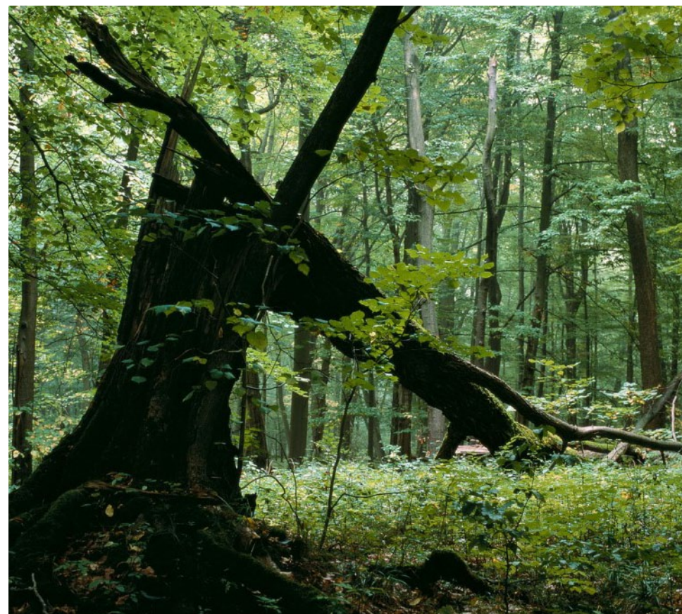
↓ Bois mort.